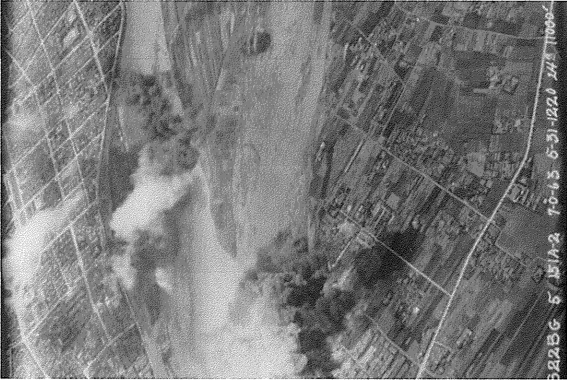
写真 A. 昭和20年(1945年)5月31日台北の高射砲陣地 の爆撃。7110空軍爆撃隊中の空中写真