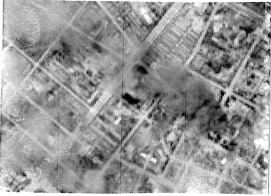
写真 B. 昭和20年(1945年)5月31日台北の総督府 爆撃の記録。7110空軍爆撃隊中の空中写真